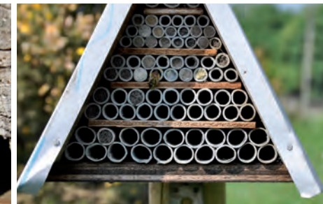
Nestkast voor solitaire bijen voorzien van nestgangen met verschillende diameters.