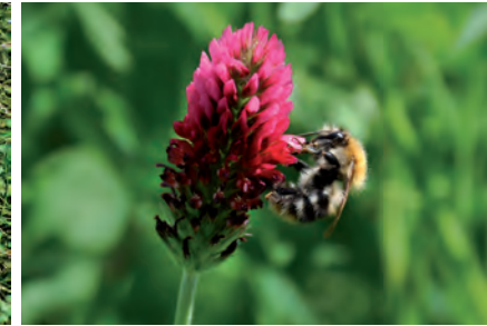
Klavers zijn een belangrijke pollen en nectarbron in het landbouwlandschap.