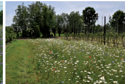
Eénjarig of meerjarig inheems bloemenmengsel met soorten als korenbloem, klaproos, margriet, rolklaver, knoopkruid, kaasjeskruid, ...

Een andere mogelijkheid is om streekeigen kruiden in te zaaien waar mogelijk. Een goede vuistregel hierbij is een verhouding van 80% grassen (geen raaigrassen) en 20% bloeiende kruiden.