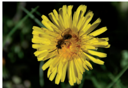
Paardebloemen vormen een belangrijke voedselbron voor bijen in het vroege voorjaar en vormen geen bedreiging voor graslanden of voor de naburige teelten.