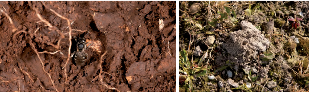
Merendeel van de wilde bijen maken hun nestgangen ondergronds.

Maar ook het voorzien van een ophoping van aarde (±50cm hoog), waarbij de zuid-gerichte helling onkruidvrij wordt gehouden, kan als nestgelegenheid dienen.