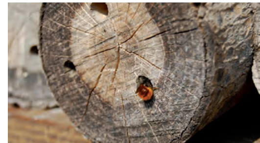
Vrouwje van een gehoornde metselbij aan het werk in nestblok

Het voorzien van bovengrondse nestgelegenheid voor een 50-tal van onze inheemse soorten kan op een heel eenvoudige wijze. Door het boren van gaten in een houtblok met verschillende diameters tussen 3 en 10mm met een diepte van \pm 10 cm of het aanbieden van een bundel holle bamboe- of rietstengels. Om de toename van parasieten, ziekten en schimmels te beperken is het aangewezen om elke drie jaar de nestblokken te vervangen of van tijd tot tijd de nestblokken te ontsmetten met een verdunde oplossing van bleekwater nadat de bijen zijn uitgevlogen. Voor meer info over hoe je hierbij het beste te werk gaat kan je contact opnemen met Proclam.