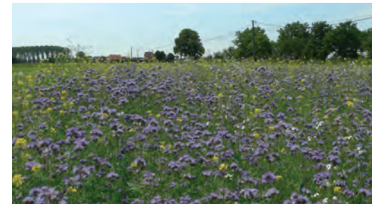
Tubinger mengsel met phacelia, gele mosterd, goudsbloem, boekweit, korenbloem,...